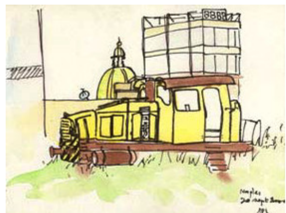
Naples, 20 septembre 2000